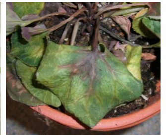
Mancha negra no aceitosa que sigue los nervios de la hoja.