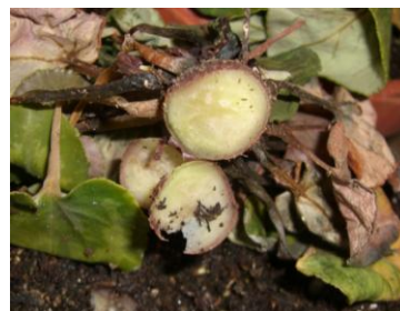
El bulbo queda duro en caso de ataque de Phytophthora sp.