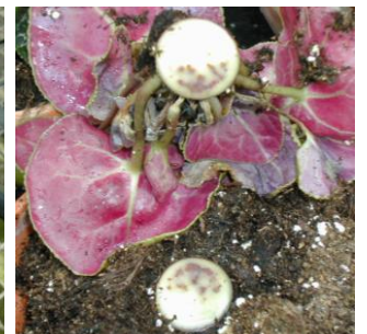
El bulbo queda duro en caso de Fusarium oxysporum f. sp. Los vasos son obstruidos por el hongo y presentan manchas marrones