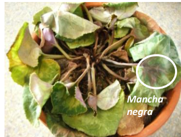
Marchitez debido a Phytophthora sp.