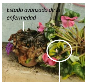
Estado avanzado de la enfermedad Amarilleamiento (color amarillo limón)