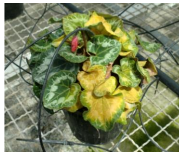
Fusarium oxysporum f. sp. Amarilleamiento color azufre del interior hacia el exterior de la hoja